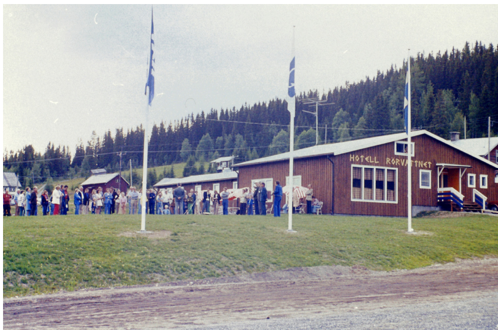
Invigningen av Fiskeskolan i Rörvattnet i juli 1974.

Skolan blev minst sagt en succé. ABU, det vill säga AB Urfabriken i Svängsta (Blekinge), var på sin tid den största leverantören av sportfiskeutrustning i Sverige. Företaget gav varje åttio år ut en reklamkatalog med sina produkter men katalogen innehöll också reklamtexter och fiskehistorier av och om dess kunder. Rörvattnet fick mängder av gratisreklam eftersom företaget också ville marknadsföra sin Fiskeskola på bästa sätt.