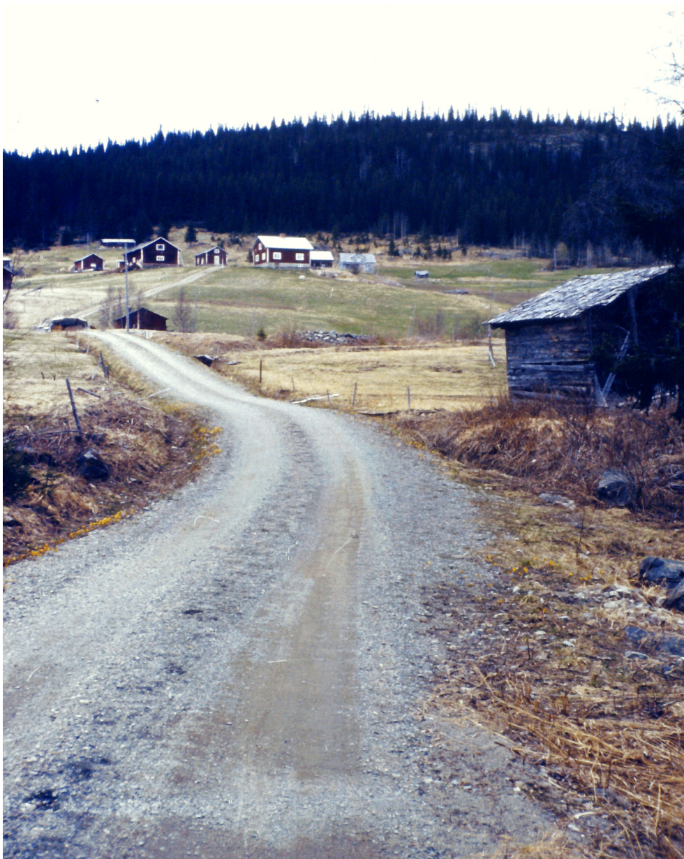
Bild 1: Vägen från bron. Så här såg det ut när man kom in till Rörvattnet från den gamla bron över Rörvattsån.