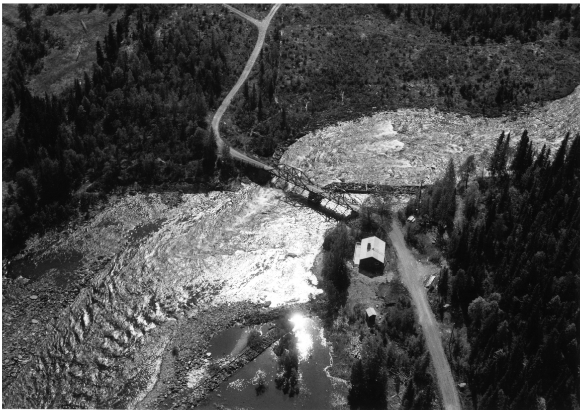
Bild 10: Den gamla bron nedanför nuvarande FiskeCampen. Efter uppdämningen på 1960-talet förvandlades den strida ån till lugnt vatten. Skogspartiet till höger kom att bilda en egen ö. Där byggnaderna fanns, är numera sjöbotten.