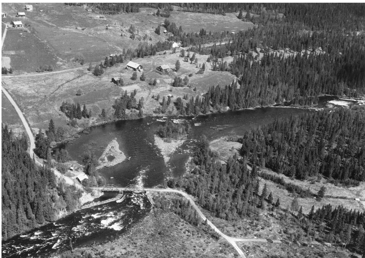
Flygbild på bron och forsen före sjöregleringen. Fiskecampen var ännu inte påbörjad. Notera det "öppna landskapet".

Redan 1916 bildade Valsjöborna en lysförening som utnyttjade fallhöjden i Rengsfallet. Rörvattnet fick sitt första kraftverk någon gång på 1920-talet och det låg ungefär där Fiskecampens båtar numera ligger. En kraftig vårflod kom sedermera att spola bort det gamla kraftverket och det dröjde till 1948 innan ett nytt kraftverk byggdes längre ner i det så kallade Kvarnfallet. Detta kraftverk försörjde en stor del av Hotagenbygden med el ända tills det avlöstes av nya Kvarnfallets kraftstation år 1970.