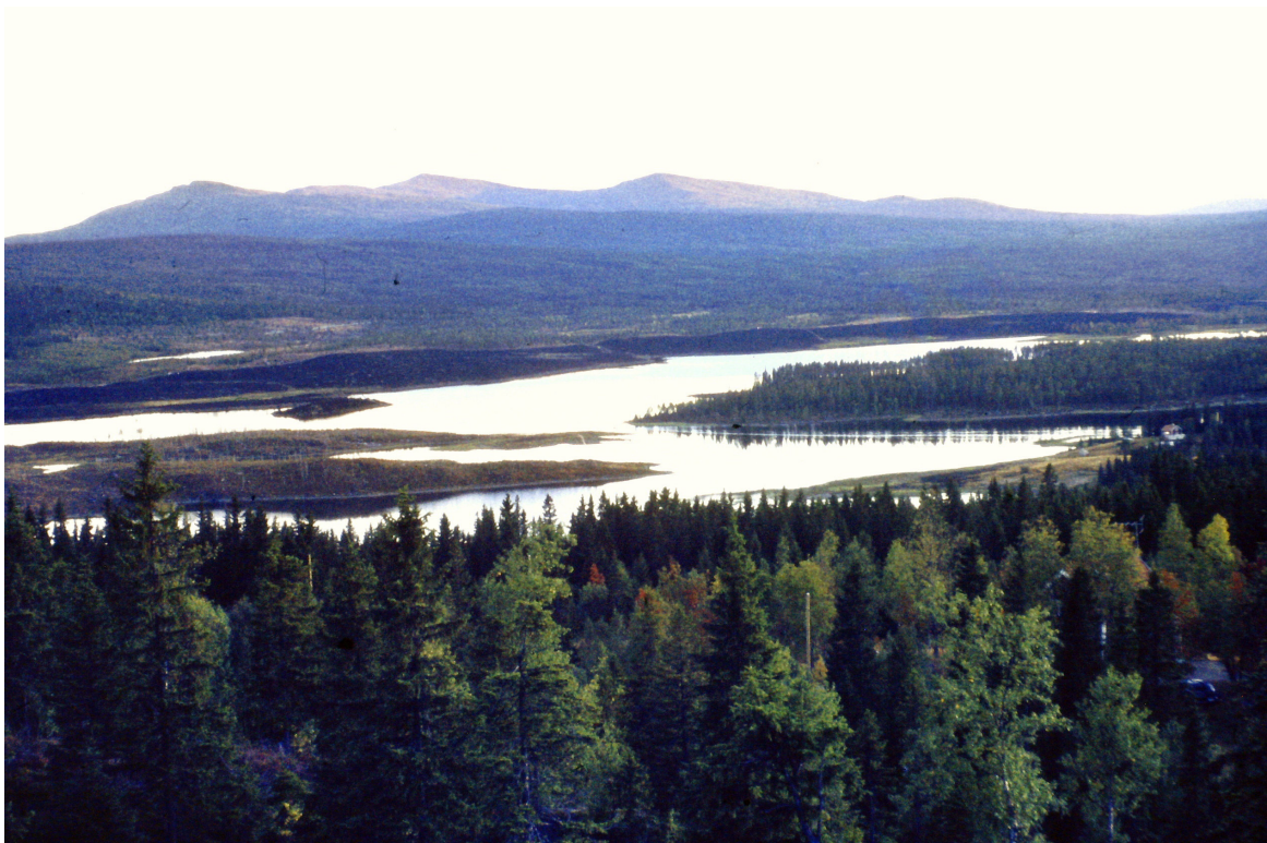
Bild 15: Inför uppdamningen i slutet av 1960-talet rensades alla strandytor som skulle läggas under vatten. Så här såg det ut innan vattnet började stiga till den nuvarande nivån.