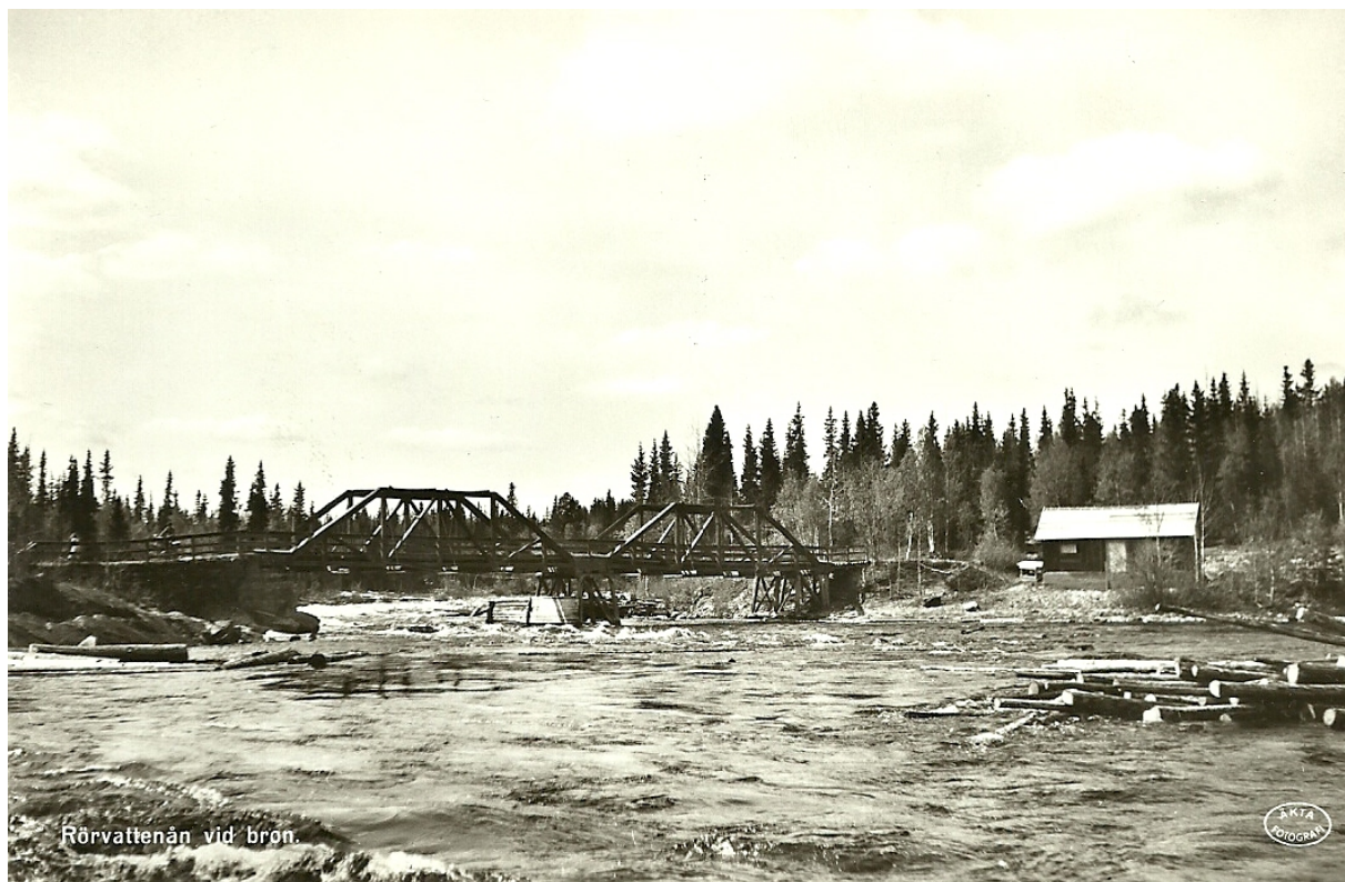
Den gamla bron över Rörvattsån som gjorde tjänst i 40 år. Huset till höger stod på den mark som idag bildar Tors Holme och revs i samband med sjöregleringen.

Beloppet motsvarar i dagens penningvärde ca 205 000 kr. För de pengarna fick man alltså en väg ner till ån från allmänna vägen och en gedigen träbro med rejäla stenkistor. Den revs i början av 1970-talet när kraftverksdammen öppnades för trafik till det alltmer utbyggda vägsystemet söder om Rörvattnet.