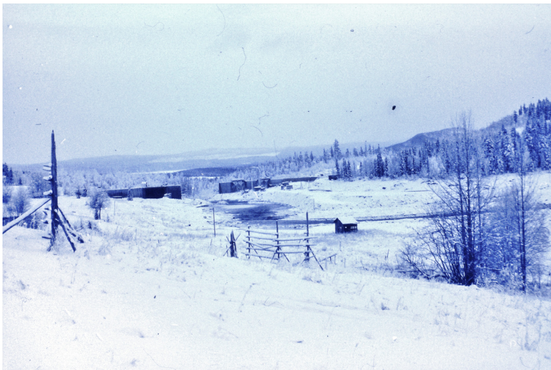
Bild 11: I mitten av 1960-talet började dammbygget vars bro kom att ersätta den gamla träbron.