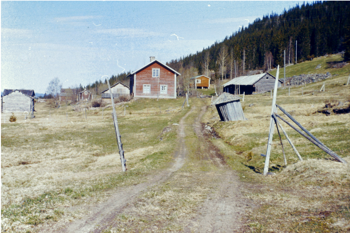
Bild 2: Den här gården, "Jontegår'n", tillhörde Rörvattnets äldre bebyggelse och revs i samband med hotellbygget i början av 1970-talet. Slalombacken kom sedan att byggas uppe i sluttningen till höger.