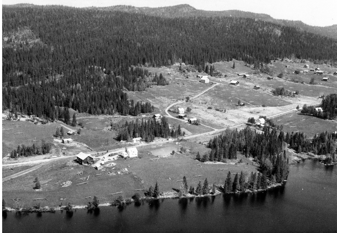
Bild 9: Flygfotot togs under 1960-talets början samband med dokumentationen av Rörvattnet inför regleringen. "Sjögårn" i förgrunden. Det öppna jordbrukslandskapet med åkrar och ängar var förhärskande.