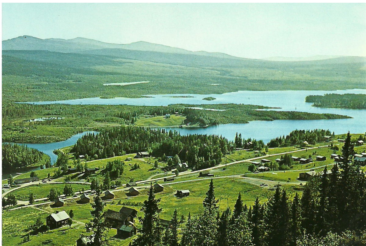
Bild 13: Hotellet är på plats, liksom den nya affären i bildens vänstra kant.