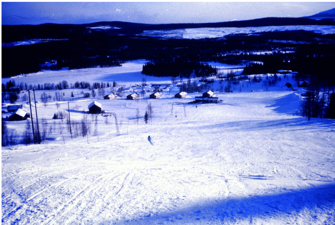
Bild 16: Slalombacken i Rörvattnet. Omtyckt av många – saknad av ännu fler.