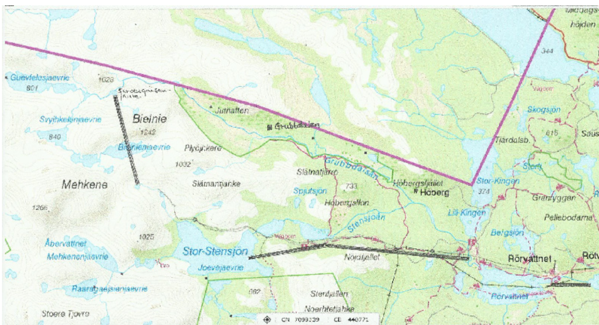
Tunnelsystemet som sträcker sig från Sarvesgaisenjaure i väster till Lockringen i öster.

Denna s.k. överledningstunnel var – åtminstone för sin tid – unik. Det var första gången man drev en så lång tunnel bara från ett håll. Tunneln gick nämligen så djupt att man inte av ekonomiska skäl kunde göra något mellanpåslag. Tunneln löper 500 meter under Bielnies topp och 100 meter under sjön Bielniejaure. År 1970 – som en sista åtgärd – sprängdes ett hål i botten på Sarvesgaisenjaure och vattenflödet till Grubbdalsån upphörde. Många fruktade att Grubbdalsån på så sätt skulle sina men den har ändå tillräckligt med biflöden för att den gamla ån kunde bevaras, om än något blygsammare i storlek.