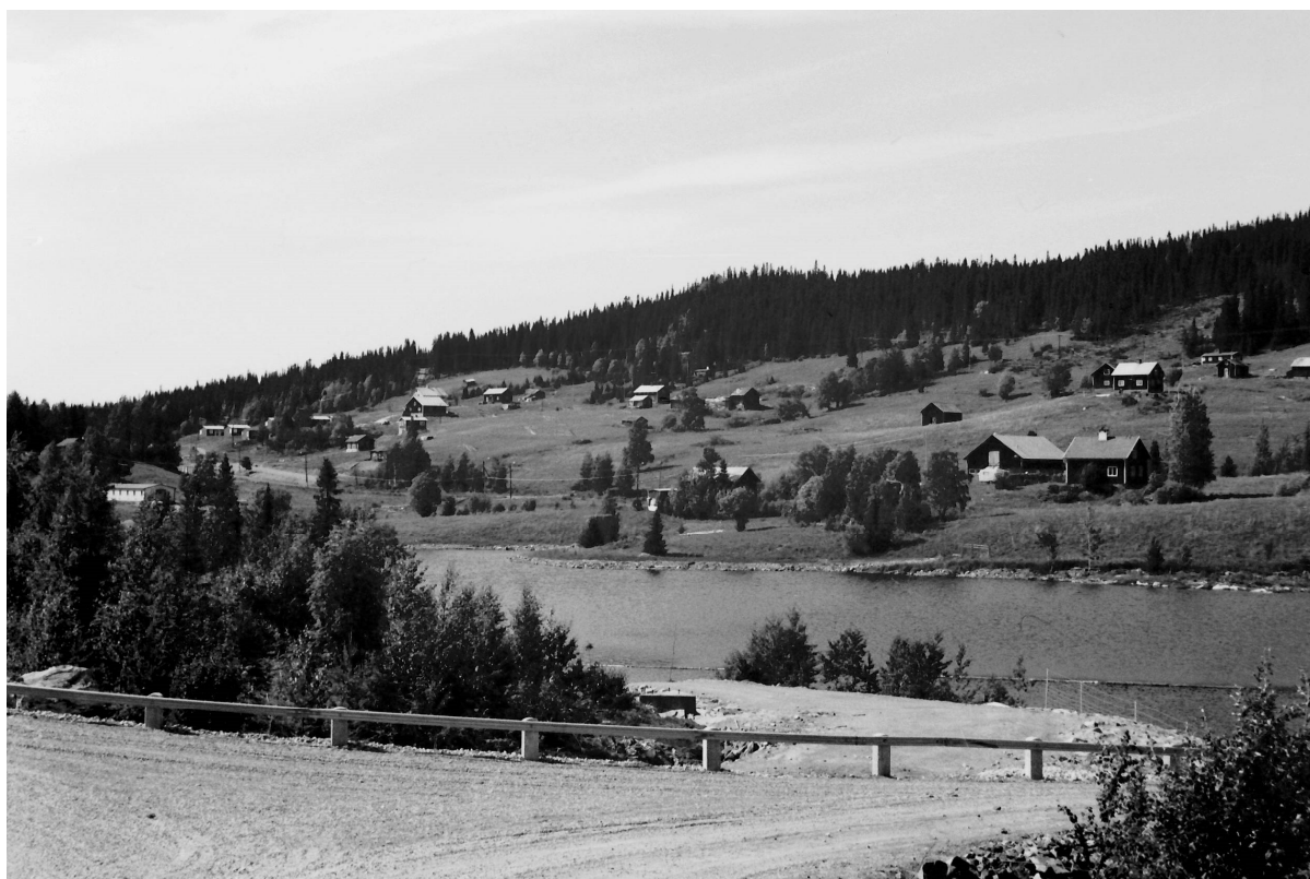
Bild12: Ungefär 1970 var dammbygget färdigt och Rörvattnets yta hade växt i betydande grad. Forsen hade tystnat. Hotellet hade ännu inte börjat byggas. Det kom att placeras ganska mitt i bilden, liksom slalombacken.