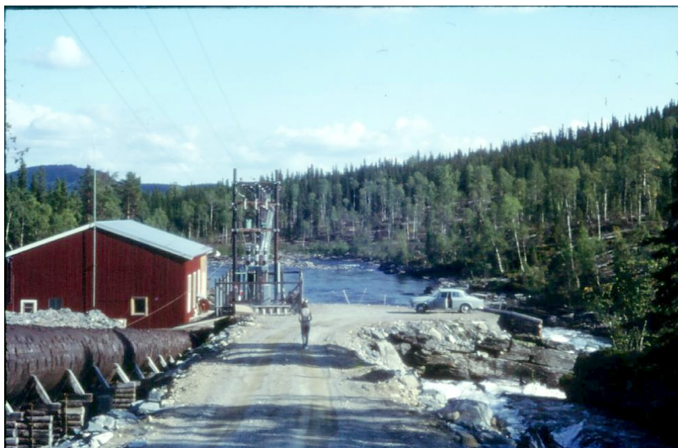
Det gamla kraftverket i Rörvattsån. Notera trätuben som förde vattnet från Rörvattnet till turbinen. Anläggningen skrotades 1970 när nya Kvarnfallets kraftverk togs i drift.

tor finns fortfarande kvar men tyvärr inget av den magnifika trätuben. Under anläggningens senare år blev trävirket en smula gistet och vattnet trycktes ut i strida strålar här och var. Det var mycket effektivt, särskilt i motljus.