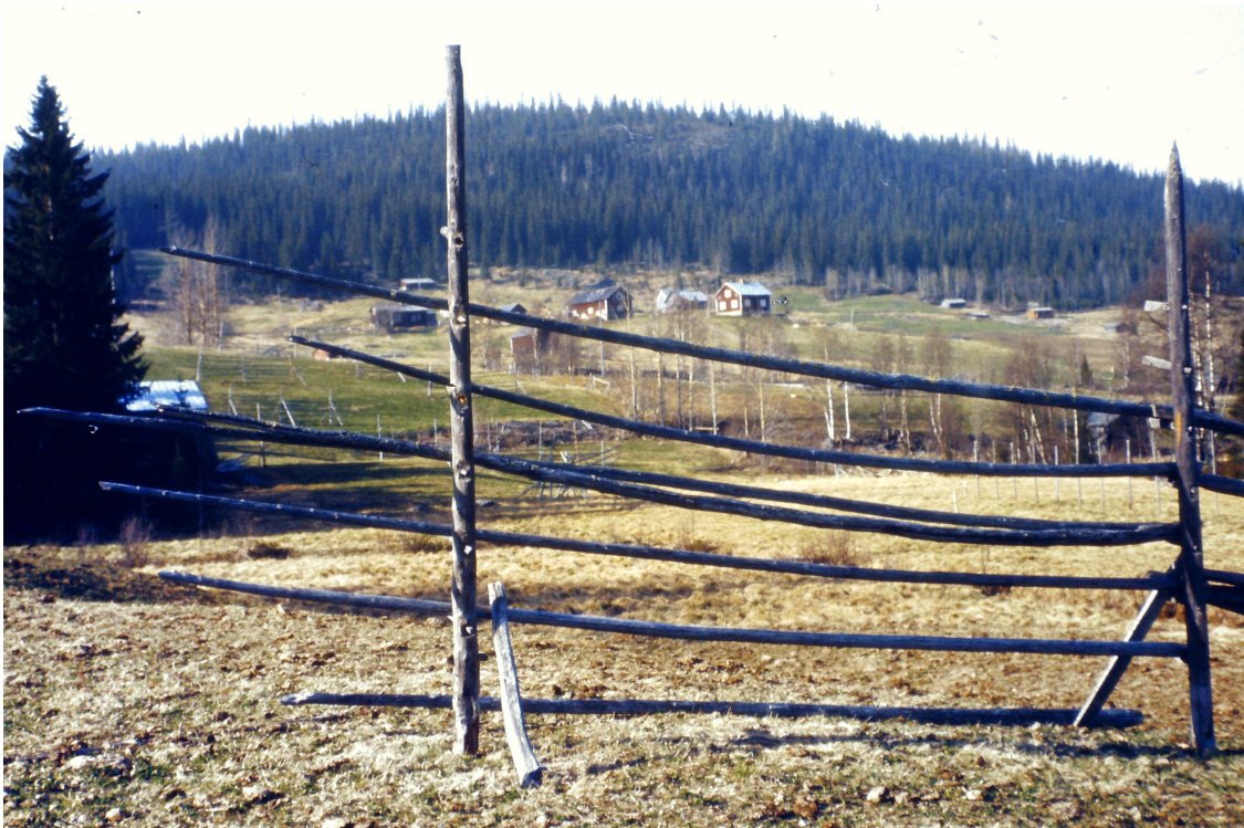
Bild 3: Bilden är tagen från lägdan (åkern) nedanför gamla affären. I bakgrunden ses Gösta Norlins hus. I förgrunden ett så kallat "hässjerö", det vill säga stommen på vilken man torkade höet inför vintern.