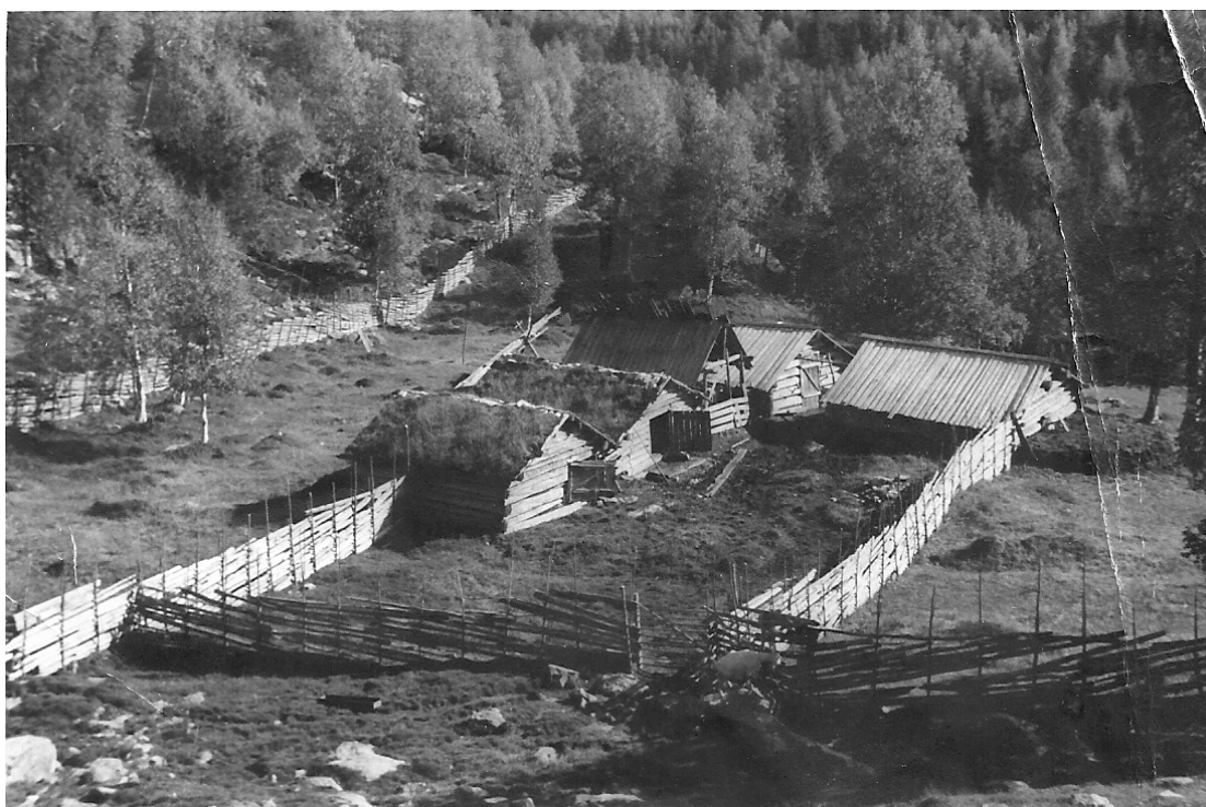
Bild 17: En gång i tiden – för länge sedan – såg det ut så här i Pellebuan. Vem kan tro det när man idag strövar omkring på platsen.